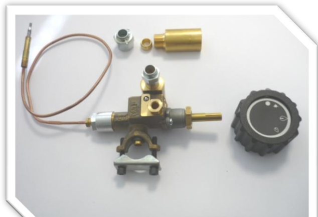
Modèle de robinet CPMM18700 avec sortie veilleuse

Gamme de robinet adaptée pour des applications foyers découverts, grils où sous plaque Equipées de brûleurs de 10 kW maxi avec ou sans veilleuse.