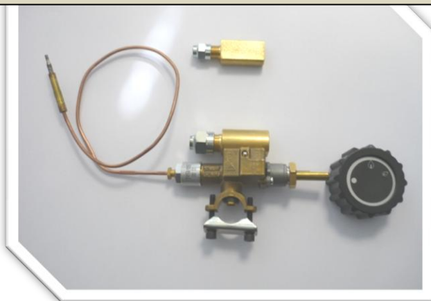
Modèle de robinet CPMM18700 sans sortie veilleuse

Ce robinet est prévu pour alimenter en gaz un brûleur fonctionnant à la pression maxi de 65 mbar, de 10 kW Hi maxi, avec une sécurité de coupure de gaz intégrée (technologie du thermocouple). Le montage sur nourrice gaz se fait par bride de serrage sur du tube de diamètre 21mm. Fonctionnement possible avec ou sans veilleuse. Possibilité de montage sur façade.